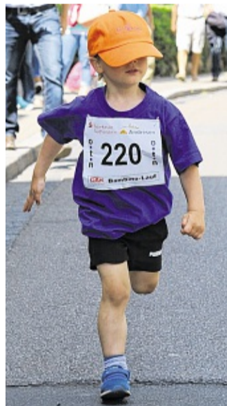
XXL-Kappe: Manch einer wählt ein ungünstiges Outfit. SELL