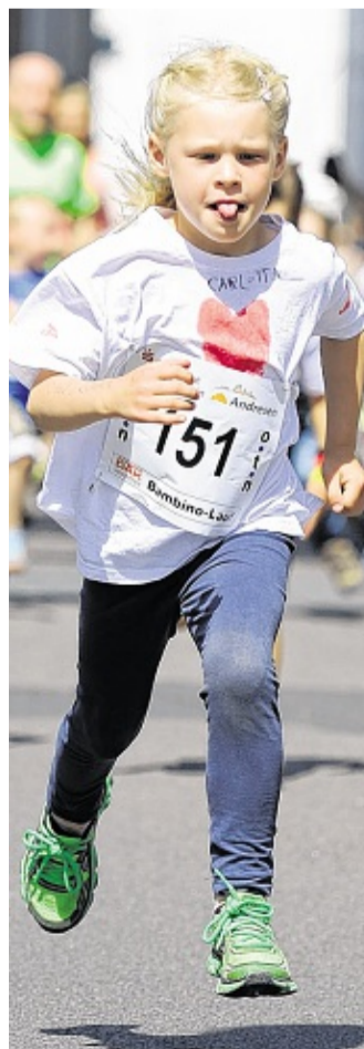
Wie die Großen: Diese voll konzentrierte Bambinoläuferin steht förmlich in der Luft. SELL