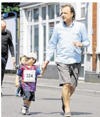
„Guck mal, die Nachbarn sind auch da.“ Manch einer ließ sich vom Publikum ablenken. SELL