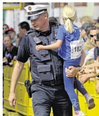
Die Polizei, dein Freund und Träger: Diese Bambinoläuferin brauchte Hilfe. KLEBENOW